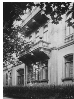
"Blavatsky-huset" i Würzburg

1885 December. En 200 siders beretning af Hodgson's undersøgelse publiceret i SPR's Proceedings – løgnagtig, unøjagtig og fornærmende mod HPB.