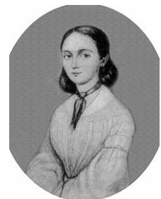
HPB's moder (1814-1842)