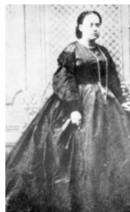
H. P. Blavatsky som ung

1844-6 Første rejse til udlandet. Rejser med hendes fader til Europa (Paris og London, 1845 siger HPB selv). Senere Sibirien op til Semipalatinsk (dvs. Semey i nutidens Kasakhstan) tæt på datidens Mongoliet. Der fandtes et Buddhistisk kloster der i Semipalatinsk i 1700 tallet med syv bygninger siges det. Blavatsky siger, at hun flere gange var på udflugt med en af hendes onkler ved grænselandet for Mongoliet, og at hun vidste alt om Tibetanere og Lamaer før hun var femten år gammel. (HPB to APS, p. 150. BCW. Vol. VI. p. 294.)