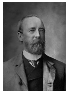
A. O. Hume (1829-1912)