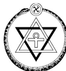
Logo Theosophical Society år 1875