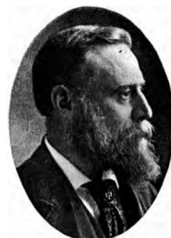
RICHARD HODGSON, LL. D., BOSTON, MASS.