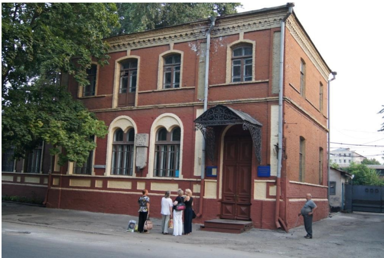
Blavatsky fødested Ekaterinoslav. I dag Blavatsky Museum. (Billedet er fra år 2013)