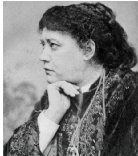
H. P. Blavatsky (1831-1891)